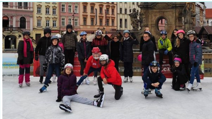
6. a 7. třída si zpestřila hodinu tělesné výchovy.