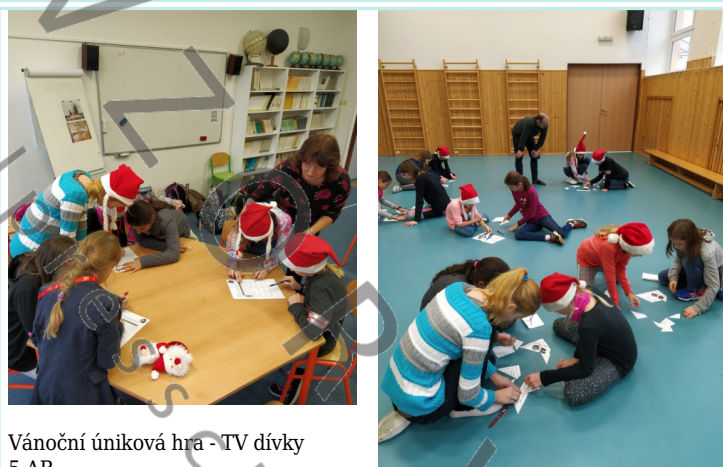
Vánoční úniková hra - TV dívky 5.AB