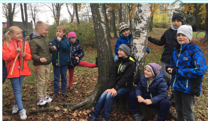
Venkovní výuka 3.A