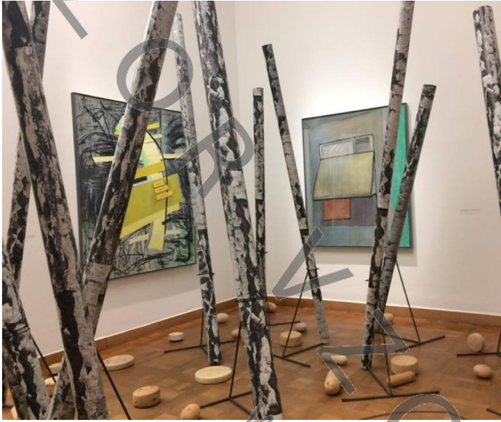
Instalace v Bank Austria Kunstforum

Měla jsem možnost jet s Pedf UK na jednodenní výjezd do Vídně. Inu, řekla jsem si, nač si takovou příležitost nechat ujít... Výlet byl nabíječčí, pln nových zajímavostí a já jsem si ho nanejvýš užila. Výjezd byl zaměřen především na oblast umění, v jehož rámci jsme postupně zavítali do tří prestižních vídeňských galerií. Jako první byla na programu Albertina , kde jsme prošli rozsáhlou výstavou o pointilismu. Zde se mimo již zmíněnou výstavu nacházely i jiné, menší, jako kupříkladu výstava o moderním a postmoderním umění či expozice fotografií z filmů - tady bylo k vidění hned několik fotografických snímků, např. z filmů Upír Nosferatu , Persona či Kabinet doktora Caligariho . Posléze jsme se vydali do Bank Austria Kunstforum , kde byla,