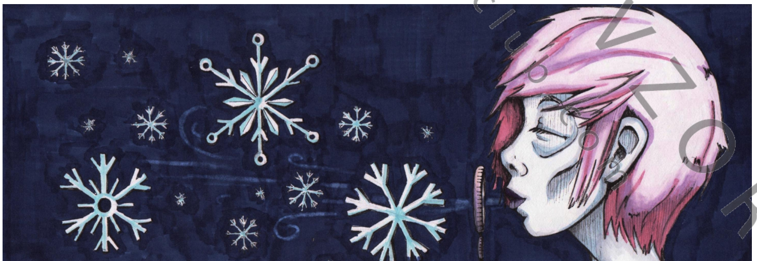
ilustrace: Magdaléna Rajchlová