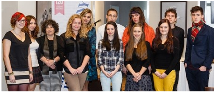
Letošní finalisté

Otcem projektu je Gymnázium Nad Štolou, která přizvalo své další čestné soupeře - Gymnázium Budějovická, Gymnázium Elišky Krásnohorské, Gymnázium Voděradská a také Gymnázium Na Zatlance. V prvním kole bylo vybráno 11 finalistů, kteří přednesli své práce ve známé pražské kavárně, kde byli následně zvoleni vítězové. Narodil od předchozích ročníků, které byly pod záštitou jednoho z nejčtenějších tuzemských autorů, Michala