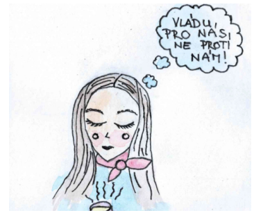
ilustrace: Březinová Petra, třída 2.P